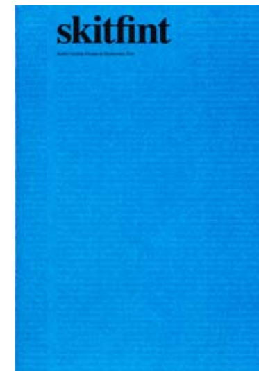
Kolla!-katalogen 2010 som vann Svenska Publishing-Priset.