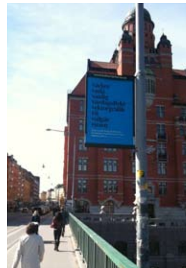
Kolla! syns överallt. Här på kulturtavlorna mitt i Stockholm.