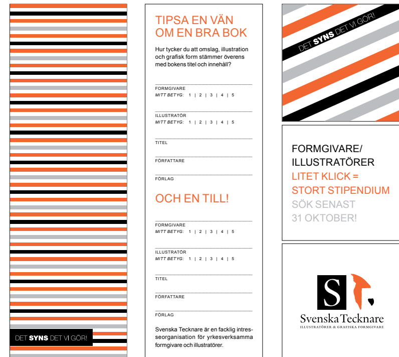
Bokmärke (fram- och baksida) till Bok- och Bibliotek 2010.

Den uppdaterade grafiska profilen färdigställdes under hösten 2010. Profilen låg till grund för nytt informationsmaterial som togs fram under året. Den grafiska profilen används också som underlag till den nya webbplatsens visuella identitet.