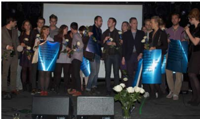
Årets pristagare visar upp glänsande diplom.