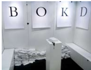
Svenska Tecknare och Illustratörcentrums monter på årets Bok- och Bibliotek i Göteborg.