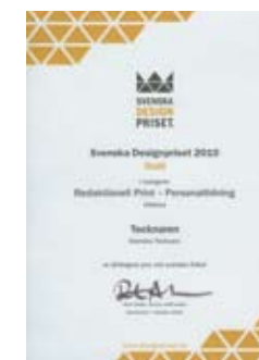
Tecknaren fick äntligen Guld i Svenska Designpriset 2010.