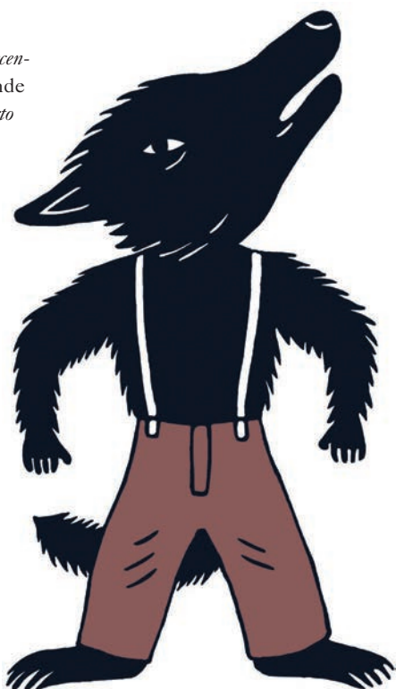
Illustration till recension av Den ylande mjölnaren av Arto Paasilinna. New York Times Book Review

– Jag anar att jag togs in delvis tack vare Konstfacks satsning på att bredda studentunderlaget vad gäller klass och etnicitet. De hade gått på mitt namn, vad mina föräldrar jobbar med och vad jag hade för betyg. Professorerna trodde att de hade tagit in någon från ett annat land.