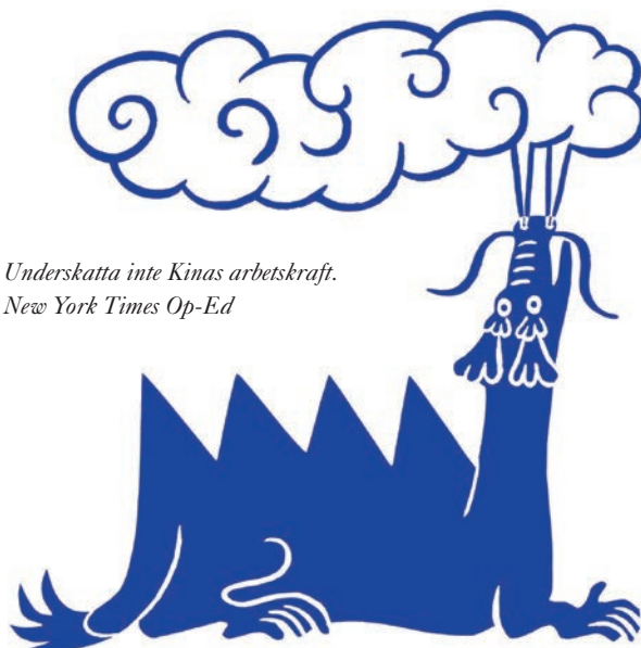
Underskatta inte Kinas arbetskraft. New York Times Op-Ed

– Om jag skulle vilja ha barn måste jag nog byta yrkesbana. Men så länge jag lever ett sorts förlängt tonårliv funkar det.